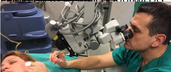
ΣΙΝΗΡΑ ΚΑΙ ΚΑΙΝΟΤΟΜΕΣ ΤΕΧΝΙΚΕΣ ΚΑΡΩΤΙΔΑΣ ΤΩΝ ΒΑΣΕΩΝ

1) Wrestler's ear management Χειρουργική αντιμετώπιση ωταιμάτων