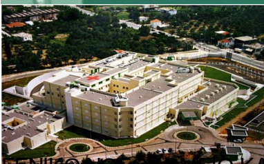
ΠΑΝΑΓΙΑΣ ΩΤΟΡΙΝΟΛΑΡΥΓΓΟΛΟΓΙΚΗ ΚΛΙΝΙΚΗ